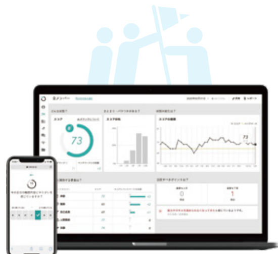
“Wevox”的评估数据、分布图、变化曲线图