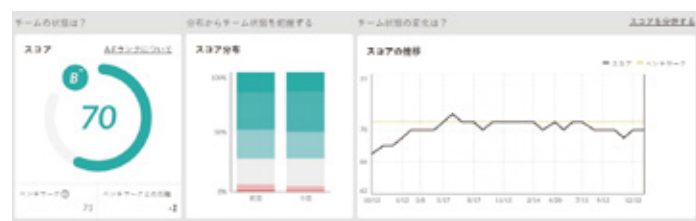
员工参与度评估和分析系统“Wevox”

日光集团 2020 年起采取措施，致力于提高员工的参与度。第一年建立了上司与下属的 1on1 面谈制度，引进了员工参与度评估和分析系统“Wevox”。第二年组织了部门研讨会。第三年计划基于此前积累的经验和营造的氛围由各部门自发采取措施，力求打造“主体性企业文化”，改善组织结构。